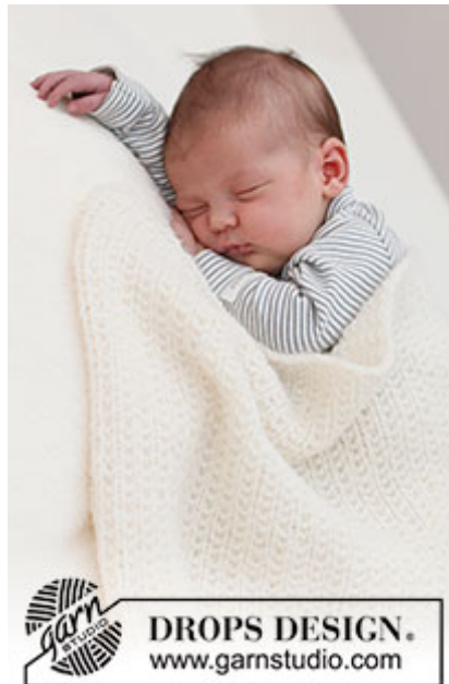
DROPS Baby 39-3

Garnforbrug ved alternativt garn – Brug vores garn-omregner her